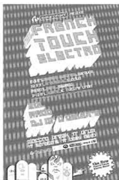
Aadd, c'est aussi un univers visuel, crée par D-drone.